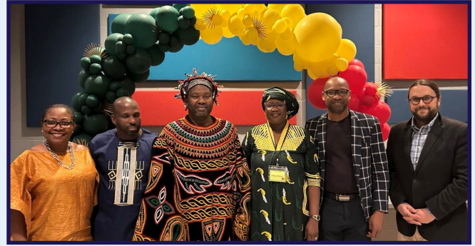
Cérémonie de clôture du Mois de l'histoire des Noirs