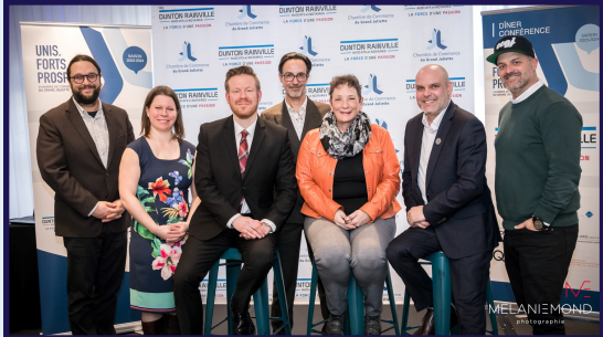
Dîner de la Chambre de Commerce du Grand Joliette