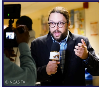
Entrevue pour NGAS TV